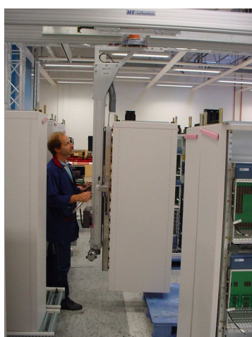
Avsugning, från pall - in i produkt