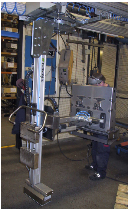
Taklyften kan även användas som en mobil arbetsstation. Här med ett vakuum-ok med både vrid & tilt.