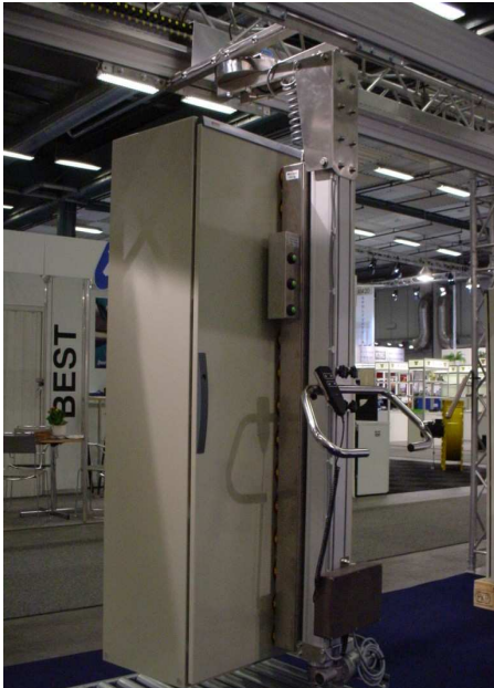
Lyft och transport av stora otypliga detaljer med vakuumgripdon, snabbt, enkelt och med stor precision utan att ens behöva ta i godset