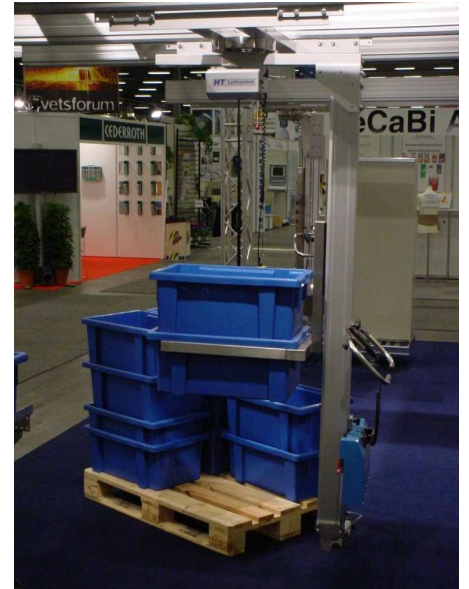
Lyft och transport av backar från pall in i lagerhyllor, komponentvagnar m.m. eller tvärt om, snabbt, enkelt och med stor precision utan att ens behöva ta i godset