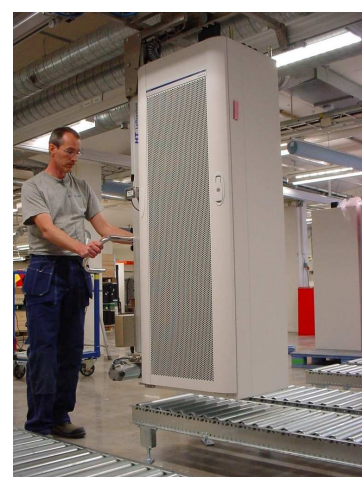
Avlämning på rullbana till produktion

Din partner vid val av funktionslösningar inom lyft och hantering av lättare gods.