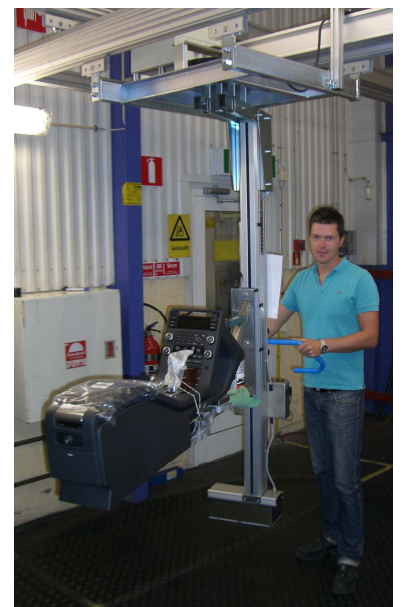
Med en lång specialbyggd gaffel hanteras mittkonsoler till bilar.

Din partner vid val av funktionslösningar inom lyft och hantering av lättare gods.