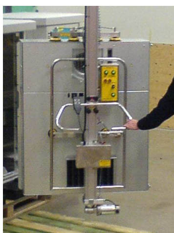
Montering, från pall - in i produkt

Komplett hanteringsstation för plockning till och från pall - I och ur maskin - På monteringsstation i produktionslinje. Du får en överlägset högeffektiv och ergonomisk arbetsplats.