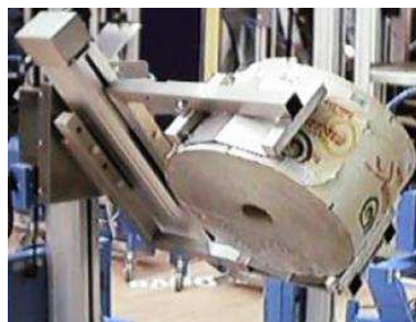
Med en kläm & vrid kan man hantera rullar och annat cirkulärt gods.